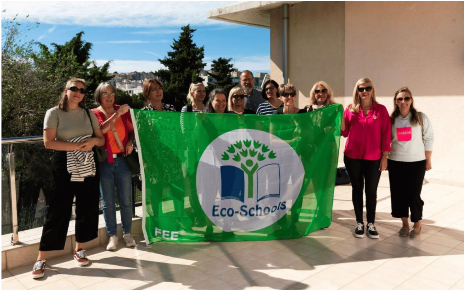
German partners delighted with the beauties of Dalmatia: VolonTERRA project in Split